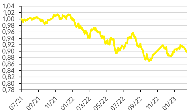
Vývoj hodnoty fondu FWR Strategy 30 EUR