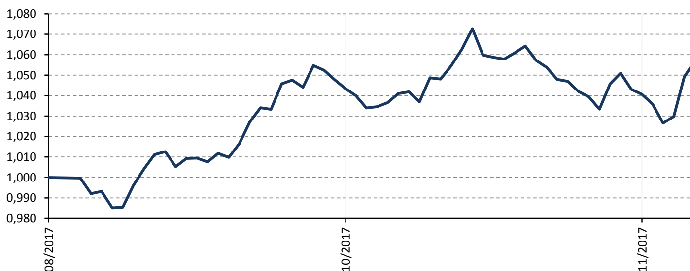
Vývoj hodnoty podílového listu fondu

V nejbližších týdnech bude pro český dluhopisový trh důležité prosincové zasedání ČNB, kde se bude rozhodovat o případném dalším zvyšování úrokových sazeb. Akciové trhy budou jistě velmi pozorně sledovat vývoj okolo americké daňové reformy, která úspěšně prošla americkým Kongresem.